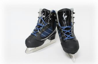
スケート靴、防具は無料貸出